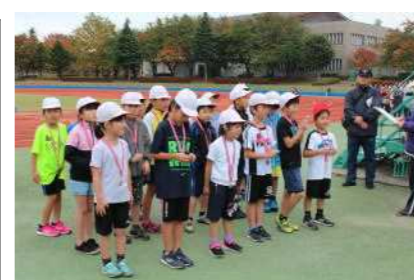
下学年3位以内入賞者