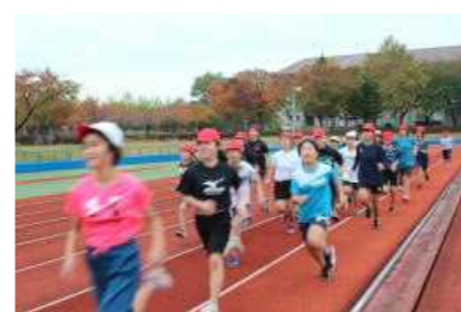
激走する高学年女子

さて、今年度も日々の中休みの全校マラソンの時間、真剣に走り抜いた子どもたちが順位を上げました。校内を歩いていると、朝の会で、「去年より一つでも順位を上げるために、今年はがんばって練習してきました」と言っていた子どもの声が廊下にこぼれてきました。顔を見ると確かにしたたる汗を拭いながら、一生懸命走る姿が見られていた子どもでした。努力すべてが良い結果となって報いられるとは限りませんが、人を成長させることは間違いありません。